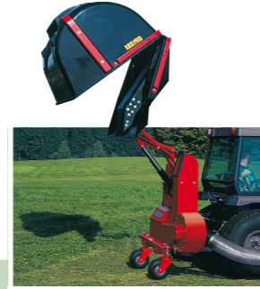
FAVORIT XP Hochentleerung bis 200 cm High dump up to 200 cm Vidage en hauteur jusqu'à 200 cm