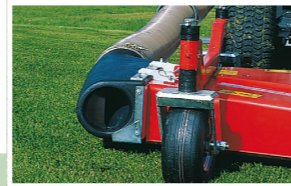
FAVORIT XP Strömungsgünstiger Ansaugstutzen Uniform flow suction chute Goulotte d'aspiration étudiée