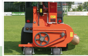
FAVORIT 650 H Neuer Riemenantrieb ohne Spannrolle New Belt drive without tension roller Entraînement par courroie sans poulie de tension