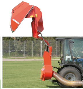
FAVORIT 650 H Hochentleerung bis 180 cm High dump up to 180 cm Vidage en hauteur jusqu'à 180 cm